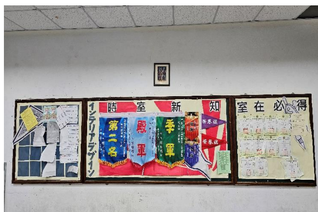
三年級佳作/室三甲