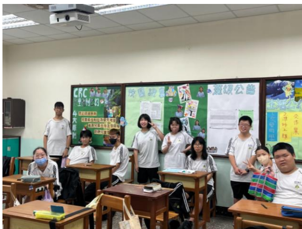
二年級第三名/餐二乙