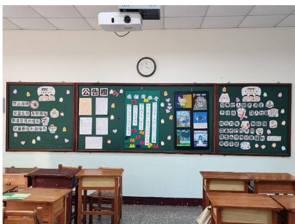
三年級第一名/餐三甲