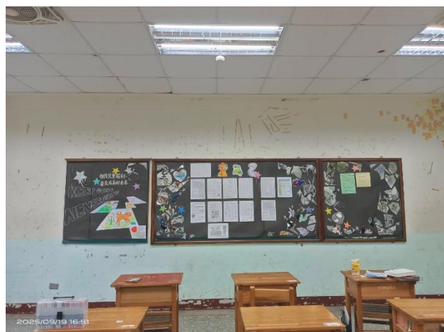
二年級佳作/室二乙