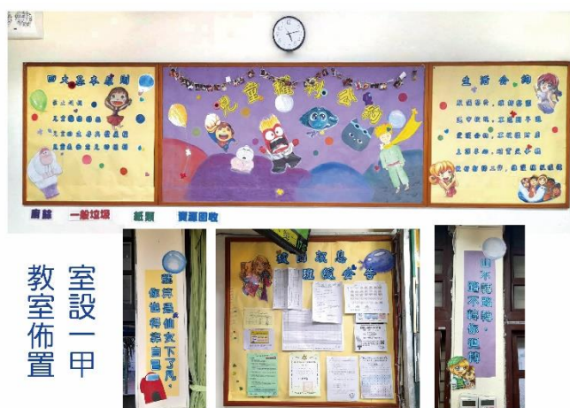
一年級第一名/室一甲