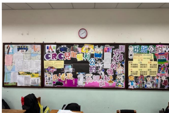
一年級第三名/餐一乙