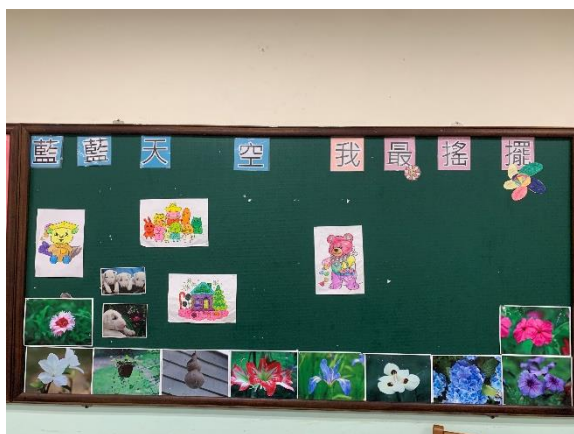
二年級第三名/資二乙