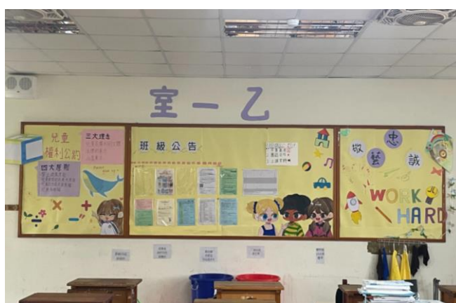
一年級佳作/室一乙