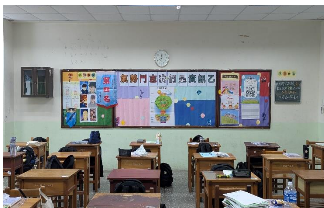
二年級第一名/資二乙