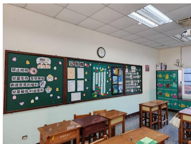
一年級第二名/餐一甲