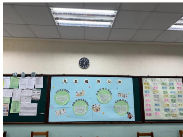
三年級第二名/資三甲