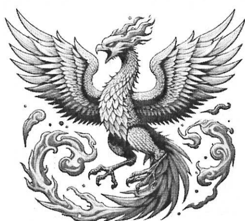
SUZAKU THE VORACIOUS